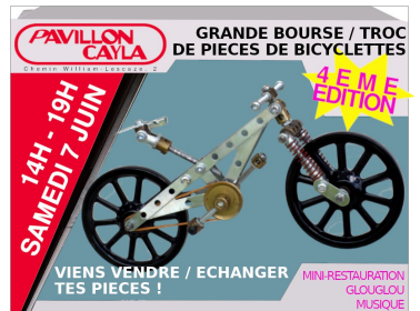
Graphisme : Julien Gourdon

Novices et expert.e.s. ont eu le plaisir de sillonner, dans le jardin du Pavillon, à la recherche de la perle rare, du dérailleur de leur rêve ou d'une belle jante rutilante. L'idée est de faire circuler du matériel sans forcément qu'il soit monnayé, grâce au principe du troc. Cette année, le troc avait lieu le 7 juin.